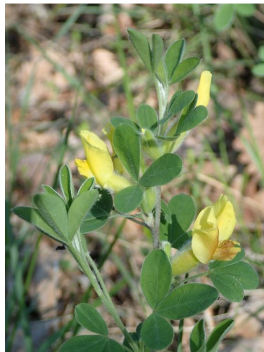
Cytise à longues grappes

Afin de repérer le cytise plus facilement lors de travaux, un marquage par des rubans rouges biodégradables a été réalisé. Merci de laisser ces marquages en place.