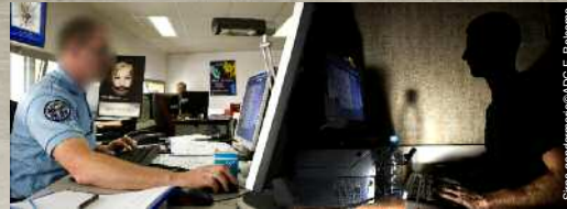
Shupa gendarmerie/ADC F. Balsamo